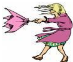
1. hace viento